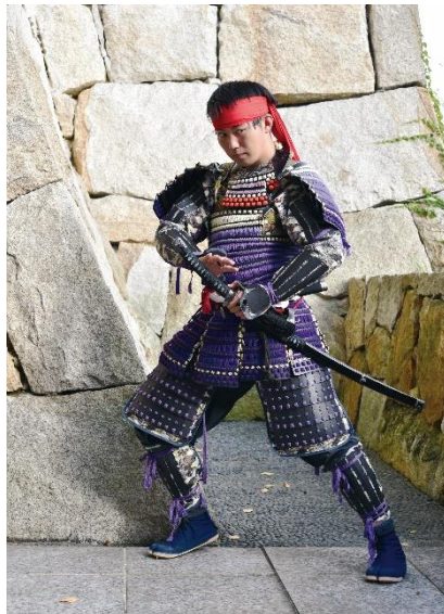
岩崎城刀劇隊 大陽寺左平次